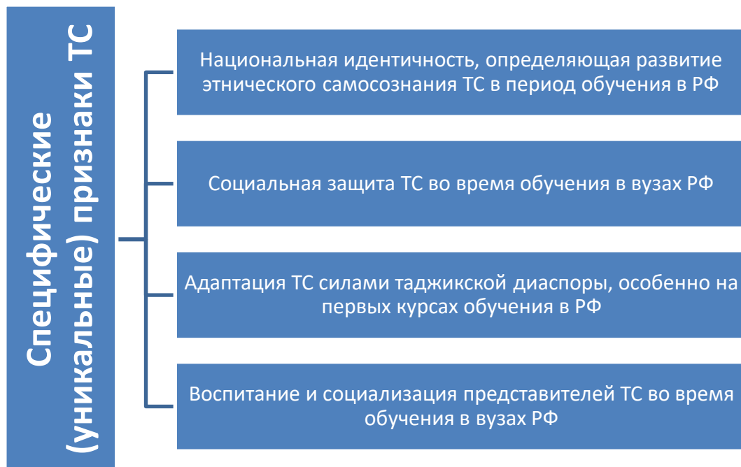
Рис. 3. Специфические признаки социальной системы таджикских студентов, обучающихся в вузах РФ как социальной системы

Таким образом, определим, что таджикские студенты, обучающиеся в вузах РФ, могут рассматриваться как социальная система. Такая социальная система может быть описана инструментарием теории управления, к ней возможно применить соответствующие управленческие решения для управления ею. Это позволит оптимизировать процессы, происходящие в ней и ориентировать на достижение определенных целевых показателей.