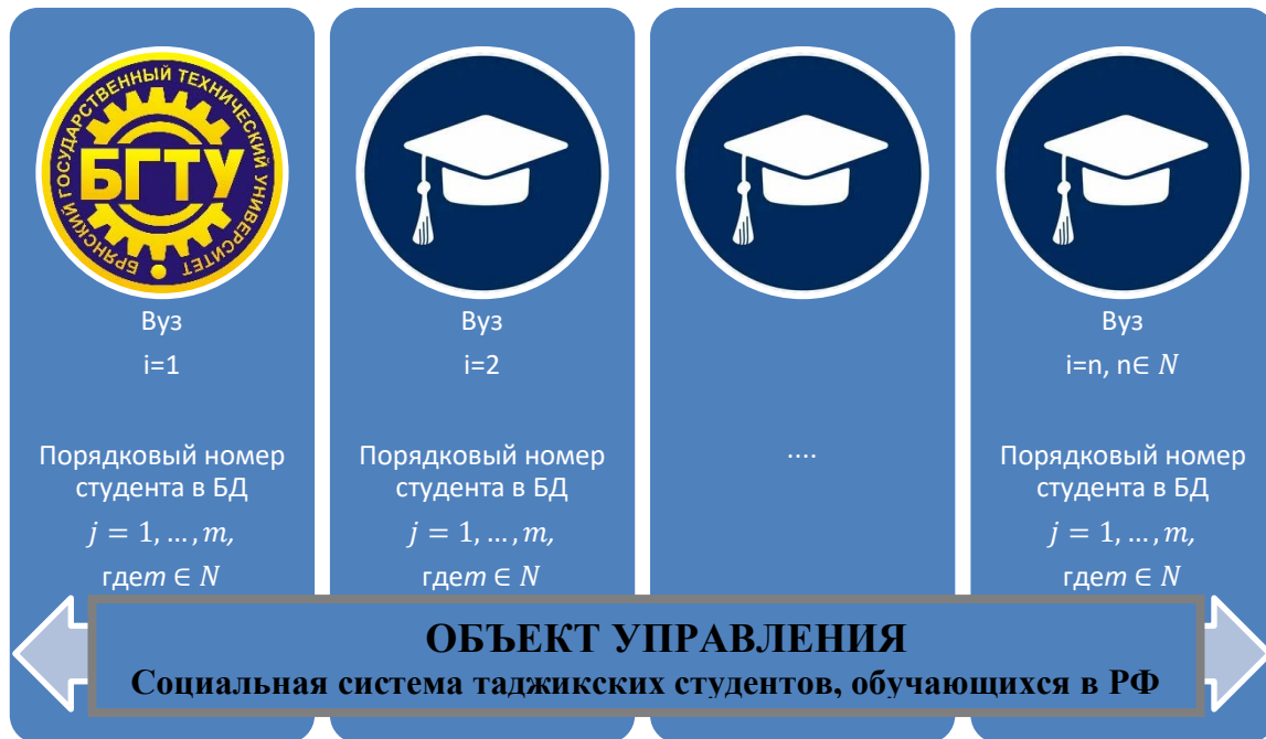
Рис. 4. Общее визуальное представление ТС как объекта управления

теории управления. Общее визуальное представление ТС как объекта управления представлено на рис.4.