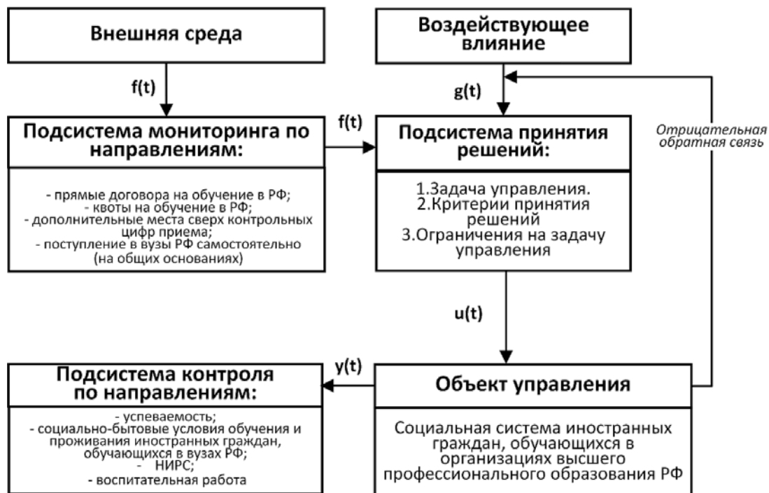
Рис. 1. Система управления социальной системой иностранных граждан, обучающихся в РФ

1. Эмерджентность социальной системы проявляется в виде появления у системы новых свойств, ранее не свойственных ее отдельным элементам. Эмерджентность есть результат возникновения новых синергических связей, которые увеличивают общий эффект до величины, превышающей сумму эффектов элементов системы, действующих независимо. Действительно, таджикские студенты, обучающиеся в РФ, могут рассматриваться как единая социальная система, обладающая новыми свойствами: здесь можно привести в качестве примера социальные последствия принадлежности таджикских студентов к соответствующей диаспоре (социальная, юридическая, культурная и проч. поддержка интересов членов диаспоры обеспечивает «защиту» интересов таджикских студентов – будущих членов диаспоры). Рассматривая студента не как представителя этой социальной системы, сложно представить потенциальные блага, приобретаемые им в качестве элемента соответствующей социальной системы – таджикской диаспоры.