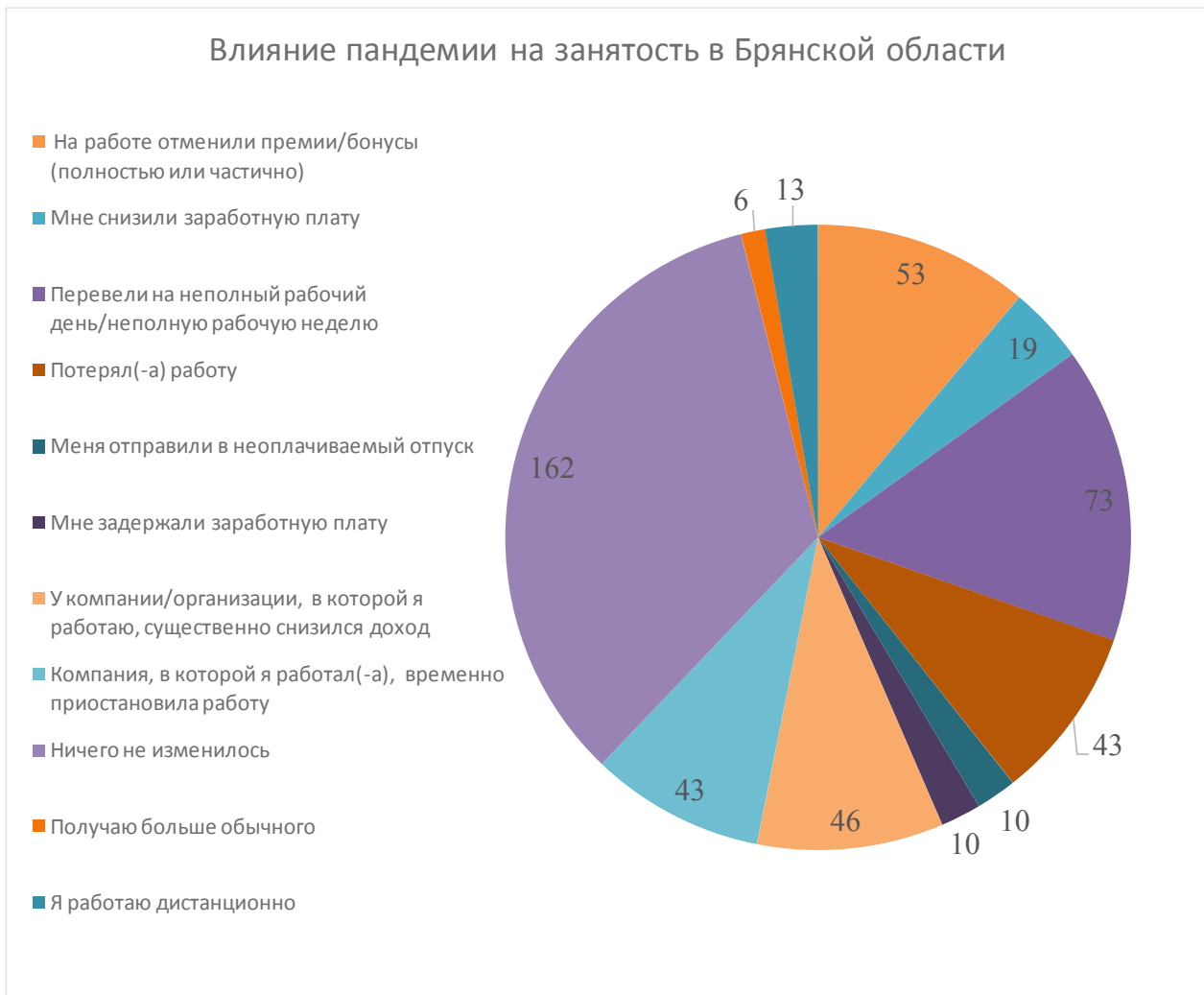
Рис. 2. Влияние пандемии на занятость в Брянской области

позволит сложить в единый массив социальные, экономические и психологические предпосылки формирования бедности. В области социальной политики необходимо выдерживать последовательный вектор на увеличение доли расходов на рекреацию и досуг у граждан. Это может быть реализовано при помощи налоговых инструментов и механизмов государственного финансирования индустрии.