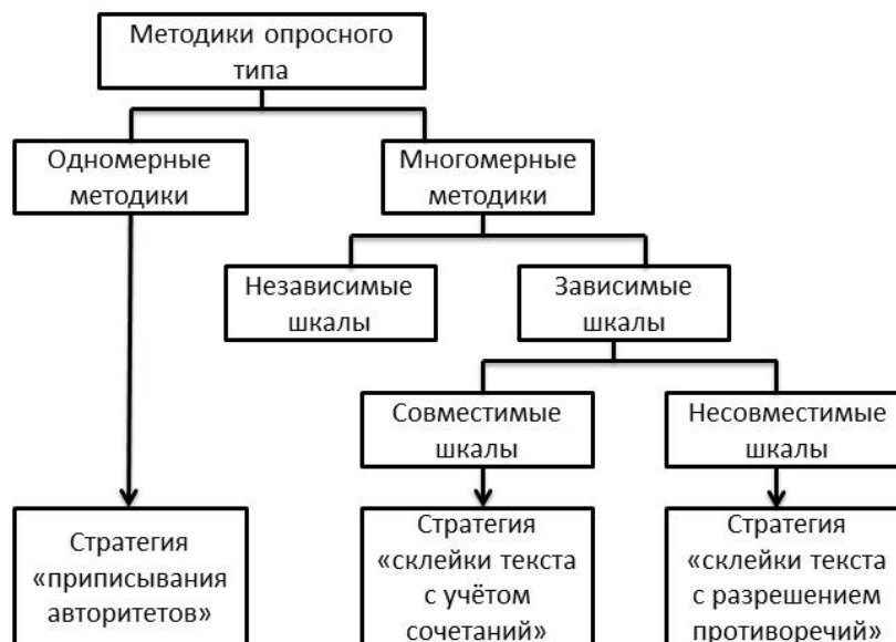
Рис. 3. Классификация психодиагностических методик с точки зрения создания компьютерной интерпретации заключений [17]

Процесс создания компьютерной интерпретации результатов тестирования зависит от ряда критериев, которые могут быть положены в основу классификации психодиагностических методик опросного типа (рис. 3).