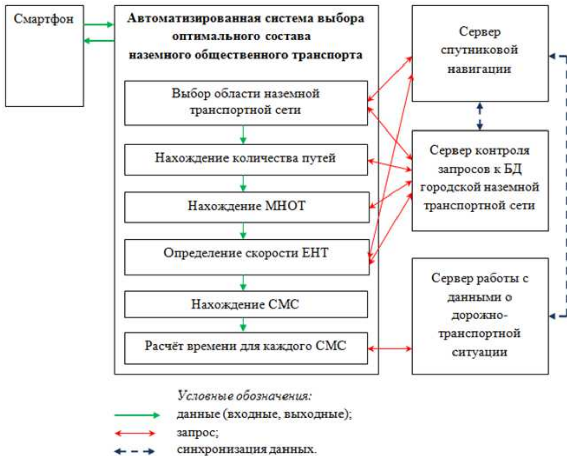
Рис. 3. Архитектура автоматизированной системы выбора оптимального состава наземного общественного транспорта

На рис. 3 представлена архитектура автоматизированной системы выбора оптимального состава наземного общественного транспорта.