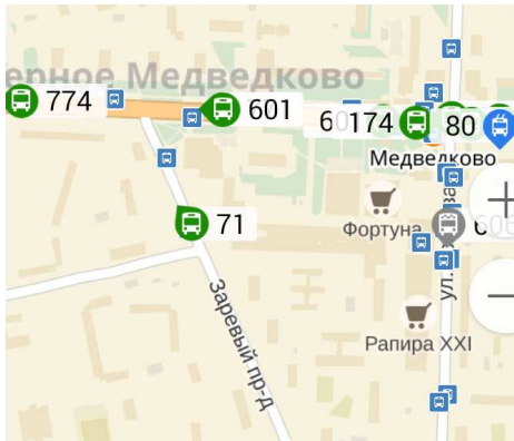
Рис. 1. Вид части окна приложения навигации наземного общественного транспорта