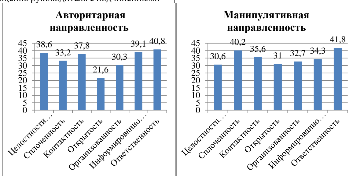
Рис. 2. Средние значения по характеристикам социально-психологического климата в коллективе руководителей с авторитарной и манипулятивной направленностью Fig. 2. Average values of the characteristics of the socio-psychological climate in the team of managers with an authoritarian and manipulative orientation

вырабатывает в коллективе единство в выполнении поставленной цели, поддержку друг друга в решении профессиональных задач, стремление иметь необходимую информацию, ответственное поведение и качественное выполнение своих обязанностей. Но, при данной коммуникативной направленности руководителя снижает в коллективе открытость, сплоченность, контактность.