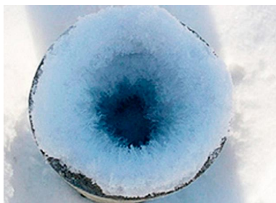
Рис. 1. Замерзший конденсат в наружной части вытяжного воздуховода (колпак снят)

происходит обледенение внутренних поверхностей вытяжных воздуховодов, находящихся вне помещения цеха машиностроительного предприятия (рис. 1). Это приводит к уменьшению проходного сечения данных воздуховодов и, соответственно, к увеличению их аэродинамического сопротивления [1, с. 247-265; 2; 3].