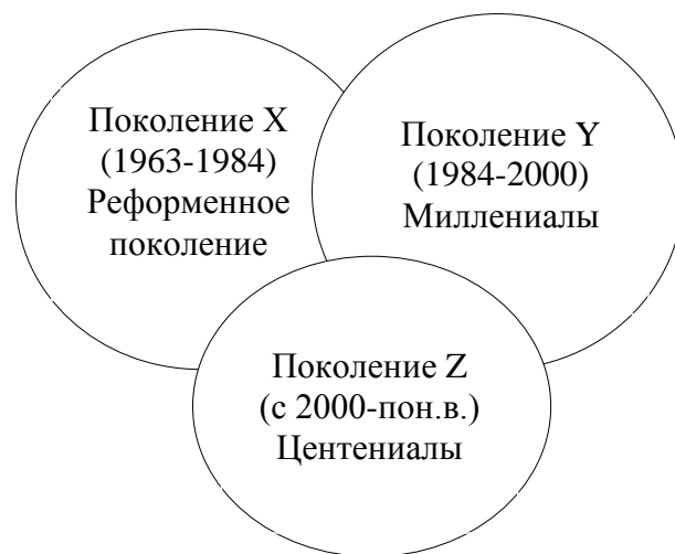
Рис.2. Связь поколений X,Y,Z с позиций образовательного социодизайна

связаны закономерности межпоколенной преемственности. [1,4,5,8,30 и др.], при этом как показано в наших и других исследованиях показана необходимость дальнейшего изучения закономерностей преемственности поколений.