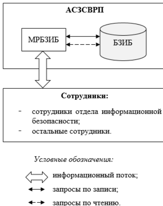
Рис. 2. Схема обращения к БЗИБ