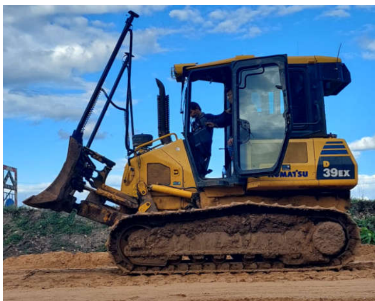
Рис. 2. Бульдозер CHCNAV TD63 с автоматизированной системой управления [8]

По утверждению разработчиков, система управления бульдозером CHCNAV строит и эффективность профилировочных работ.