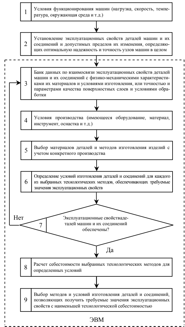
Рис. 3. Структурная схема одноступенчатого решения конструкторско-технологической задачи обеспечения качества проектируемой машины

Как было сказано, для выпуска конкурентоспособных изделий зачастую возникает необходимость повышения долговечности отдельных деталей до ее оптимального значения. С этой целью используются различные технологические методы обработки рабочих поверхностей и нанесения износостойких и коррозионно-стойких покрытий.