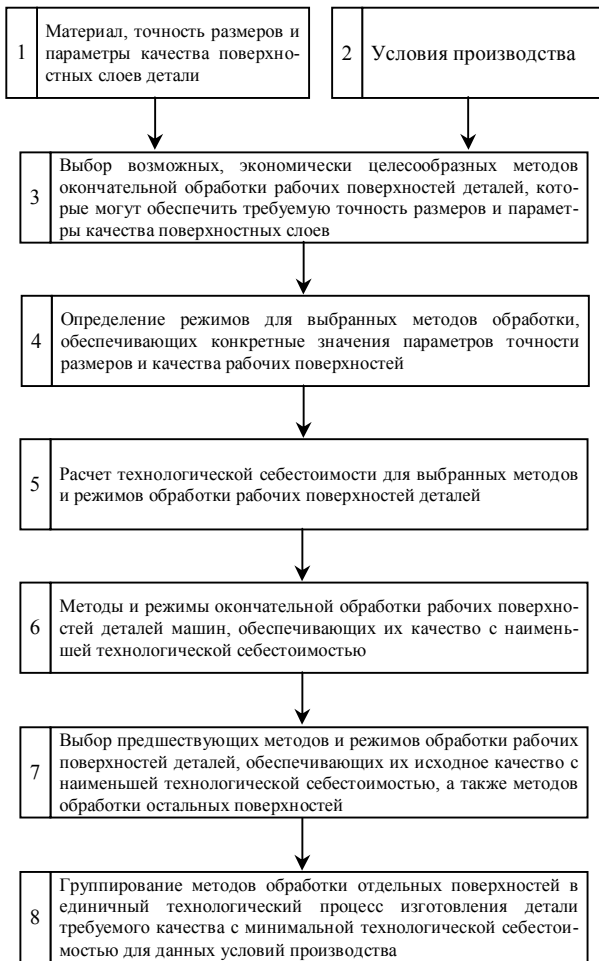
Рис. 2. Структурная схема алгоритма решения задачи технолога

Но для этого необходимо иметь справочные данные по технологическому обеспечению непосредственно эксплуатационных свойств. Эти данные могут быть получены теоретически и экспериментально. Теоретически – на основе рассмотрения единства процесса обработки и эксплуатации деталей, в частности с применением энергетической теории. Экспериментально – применением эмпирических уравнений взаимосвязи эксплуатационных свойств с режимами обработки.